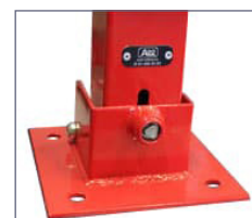
Opcional: clau triangular.